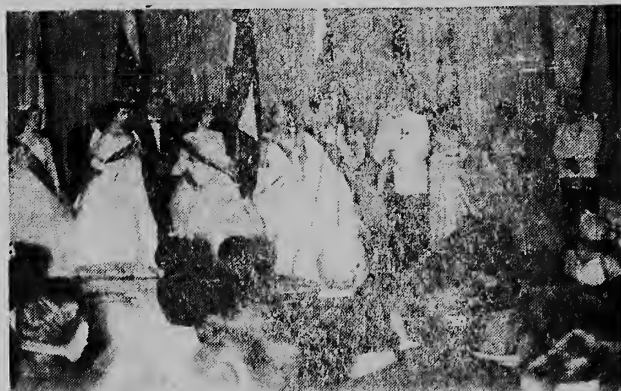
Un portret di e eleccion di Reina di Lions durante e convencion di 1960 den Aruba Caribbean Hotel.